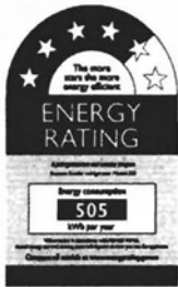
图1 无霜冰箱、房间空调器、直冷式冰箱、配电变压器、电热水器以及洗衣机的能效标签

这些法规规定了管形荧光灯、房间空调器、配电变压器和无霜冰箱的能效标签样式及标示方法。